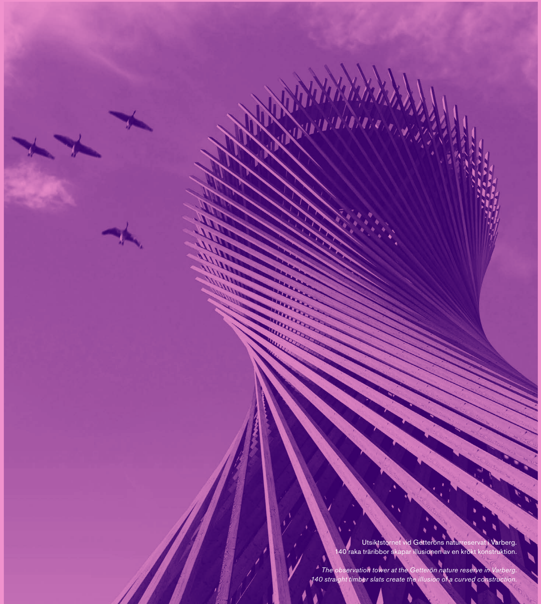
Utsiktstornet vid Getteröns naturreservat i Varberg. 140 raka träribbor skapar illusionen av en krökt konstruktion.

With Informed Design as a tool, over the next few years White Research Lab will focus on the development and implementation of solutions that, amongst other things, also help us to realise the Strategic Plan's goal that all our architecture is innovative, beautiful, sustainable and carbon neutral by design.